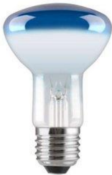
Joonis 1. Hõõglamp